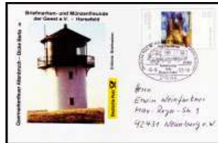
Nr 5 - Quermarkenfeuer Altenbruch SSt Harsefeld 6.9.2003 BD-ETH 005 3,50 €