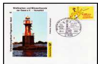
Nr 14 - Orientier.feuer Pagensand SSt Harsefeld 20.2.2005 BD-ETH 014 3,50 €