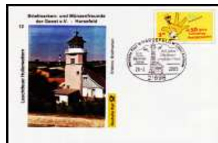
Nr 12 - Leuchtfeuer Hollerwettern SSt Harsefeld 20.2.2005 BD-ETH 012 3,50 €