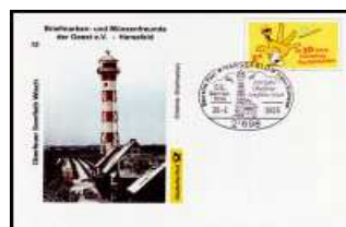
Nr 15 - Oberfeuer Somfleth Wisch SSt Harsefeld 20.2.2005 BD-ETH 015 3,50 €