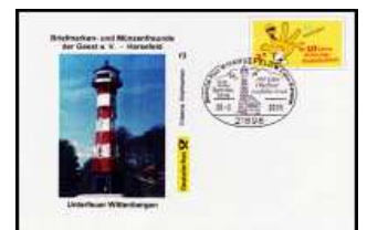
Nr 13 - Unterfeuer Wittenbergen SSt Harsefeld 20.2.2005 BDETH 013A 3,50 €