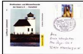
Nr 2 - Leitfeuer Juellsand SSt Harsefeld 7.9.2003 BD-ETH 002 4,50 €