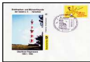
Nr 22 - Oberfeuer Pagensand SSt Fredenbeck 21.10.2005 BD-ETH 022 3,50 €