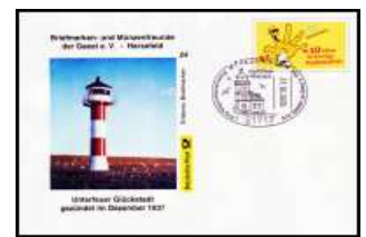
Nr 24 - Unterfeuer Glückstadt SSt Fredenbeck 21.10.2005 BDETH 024 3,50 €