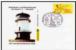
Nr 4 - Leitfeuer Balje SSt Harsefeld 20.2.2005 BD-ETH 004 B 3,50 €