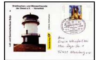
Nr 4 - Leitfeuer Balje SSt Harsefeld 6.9.2003 BDETH 004 A 4,50 €