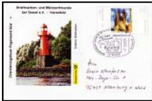
Nr 1 - Orientier.feuer Pagensand SSt Harsefeld 7.9.2003 BD-ETH 001 4,90 €