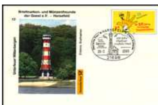
Nr 13 - Unterfeuer Wittenbergen SSt Harsefeld 20.2.2005 BD-ETH 013B 3,50 €