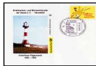
Nr 23 - Unterfeuer Pagensand SSt Fredenbeck 21.10.2005 BD-ETH 023 3,50 €