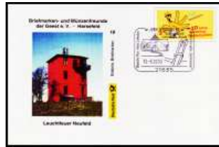
Nr 18 - Leuchtturm Neufeld SSt Jork 12.5.2005 BD-ETH 018 3,50 €