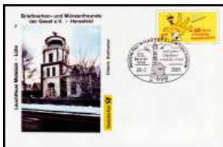
Nr 7 - Leuchtfeuer Mielstack SSt Harsefeld 20.2.2005 BD-ETH 007 3,50 €