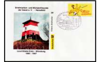
Nr 20 - Leuchtbake Este-Mündung SSt Sauensiek 4.9.2005 BDETH 020 3,50 €