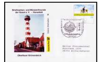
Nr 9 - Oberfeuer Grünendeich SSt Grünendeich 10.4.2009 BBETH 009B 3,50 €