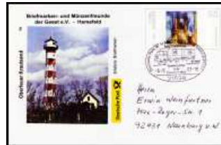
Nr 3 - Oberfeuer Krautsand SSt Harsefeld 6.9.2003 BD-ETH 003 4,50 €