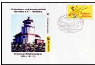
Nr 21 - Unterfeuer Bützflthersand SSt Sauensiek 4.9.2005 BD-ETH 021 3,50 €