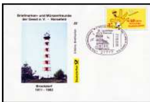
Nr 25 - Brockdorf SSt Fredenbeck 21.10.2005 BD-ETH 025 3,50 €