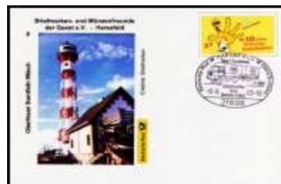
Nr 8 - Oberfeuer Somfleth Wisch SSt Harsefeld 6.9.2003 BD-ETH 008 3,50 €