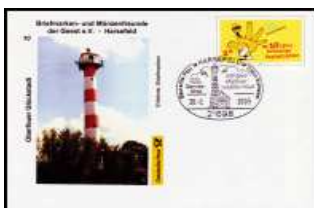
Nr 10 - Oberfeuer Glückstadt SSt Harsefeld 20.2.2005 BD-ETH 010 3,50 €