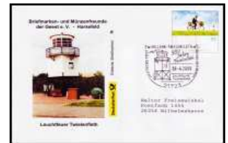
Nr 6 - Leuchtfeuer Twielenfleth SSt Harsefeld 28.6.2009 BD-ETH 006B 3,50 €