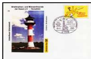
Nr 11 - Unterfeuer Glückstadt SSt Harsefeld 20.2.2005 BD-ETH 011 3,50 €