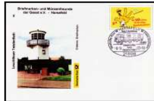
Nr 6 - Leuchtfeuer Twielenfleth SSt Harsefeld 6.9.2003 BD-ETH 006A 3,50 €