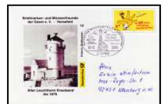
Nr 16 - Alter Leuchtt. Krautsand SSt Harsefeld 20.2.2005 BBETH 016 3,50 €