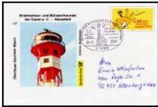
Nr 17 - Oberfeuer Somfleth Wisch SSt Harsefeld 20.2.2005 BD-ETH 017 3,50 €