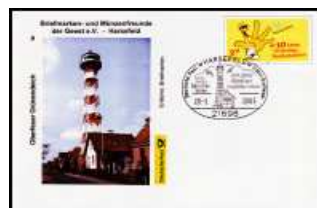
Nr 9 - Oberfeuer Grünendeich SSt Harsefeld 20.2.2005 BD-ETH 009A 3,50 €